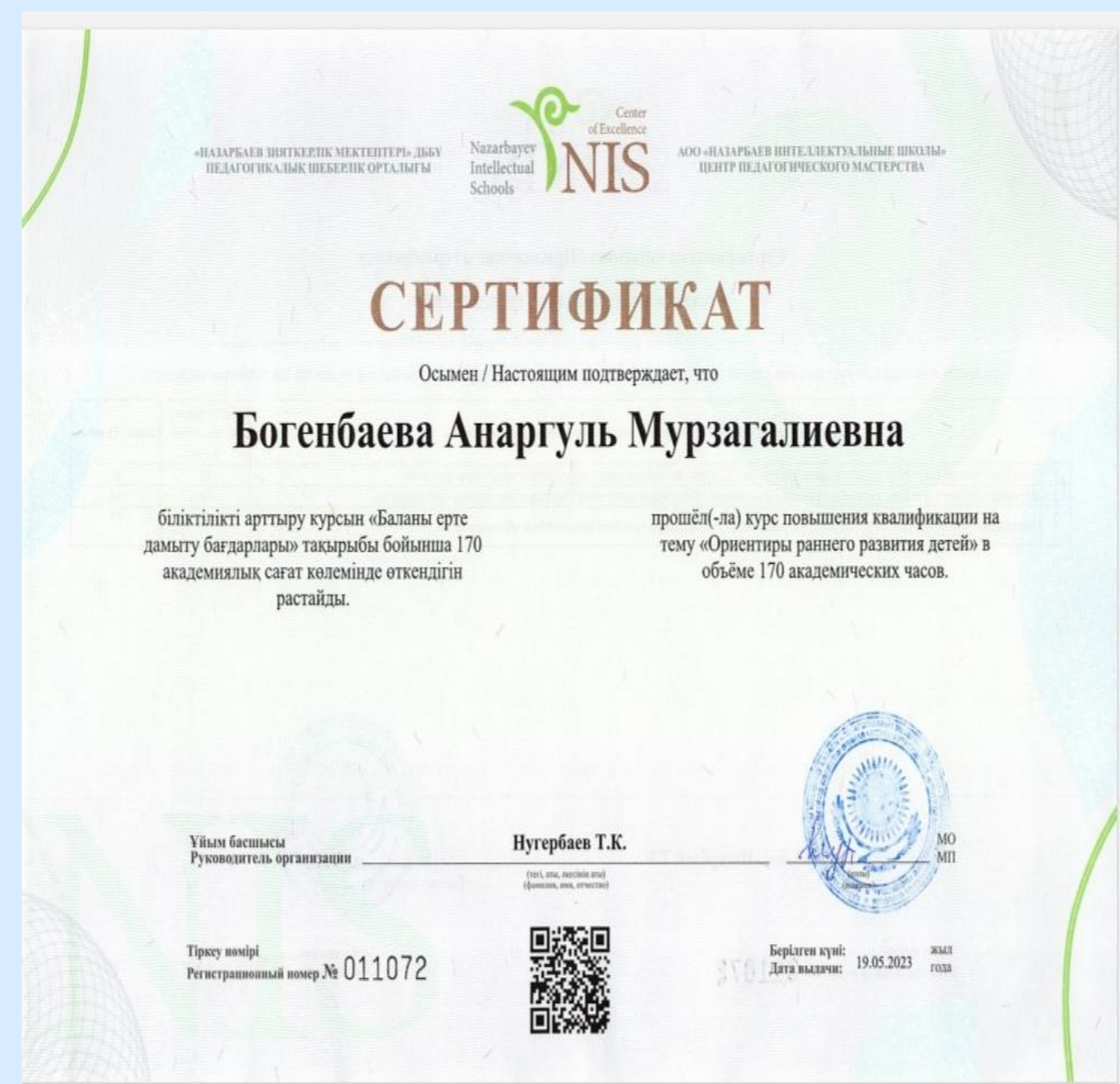
«Ориентиры раннего развития» ЦПМ г. Кокшетау