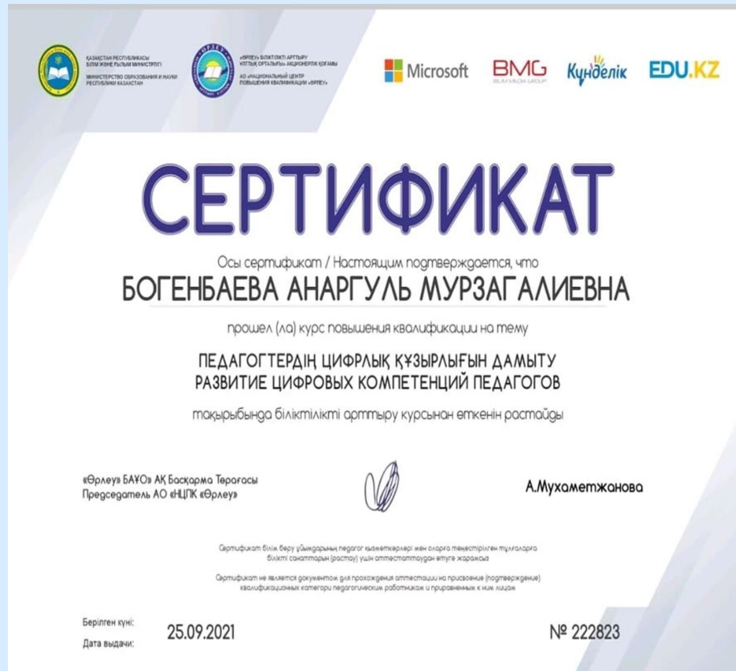
«Развитие цифровых компетенций педагогов» АО «НЦПК «Өрлеу»